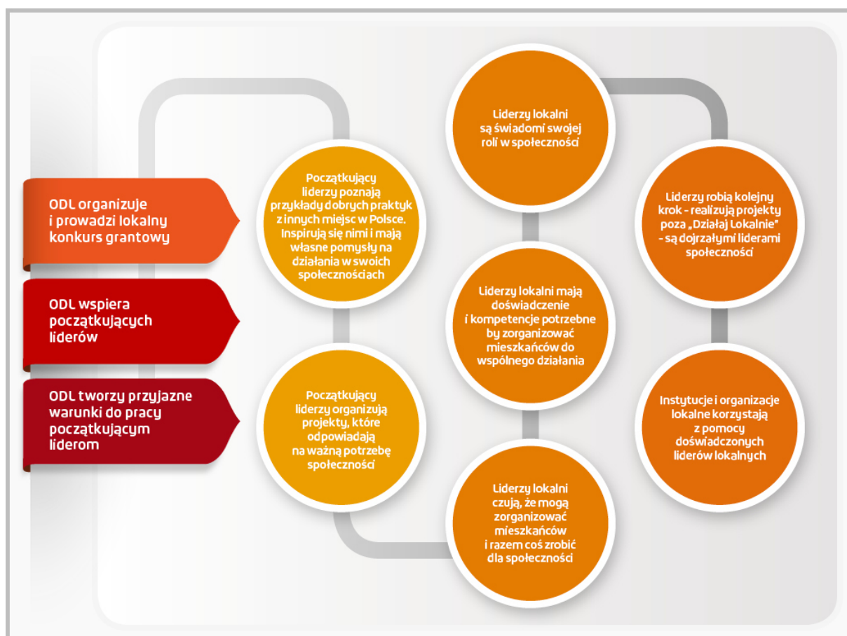
Ścieżka rozwoju animatorów lokalnych do liderów w Programie „Działaj Lokalnie”

Operatorem platformy jest Fundacja Akademia Organizacji Obywatelskich, organizacja dbająca o wysoką jakość zarządzania w trzecim sektorze i podnoszenie kwalifikacji menedżerskich przez kadrę zarządzającą polskimi organizacjami pozarządowymi.